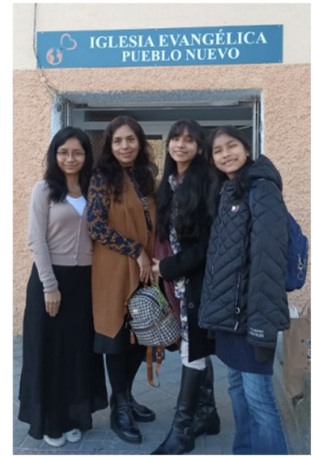
Foto 5: Oren por este local donde podamos recibir familias nuevas y compartir la palabra de Dios, es un lugar alejado de la ciudad; si Dios permite sería un lugar estratégico. En el mes de abril esperamos que Dios confirme el progreso de nuestra propuesta de alquiler. Oren por una movilidad que es necesario en este tiempo.

En distintos lugares de Castilla y León existen pequeñas Iglesias evangélicas que necesitan obreros dispuestos a servir a medio tiempo. No hay Iglesias Bíblica Bautistas en los pueblos alejados.