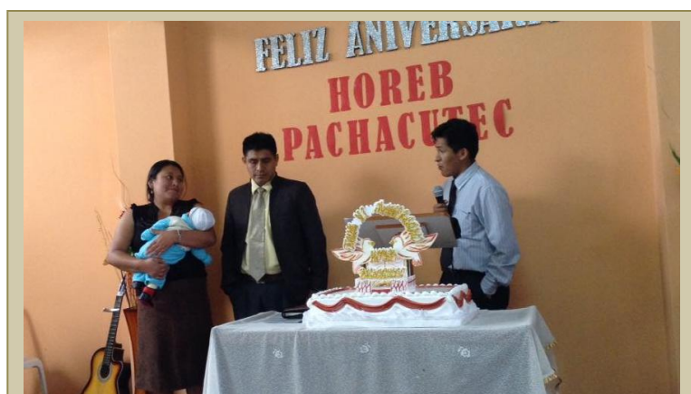
Dedicación de bebé

Walmart Letona y familia Correo: walmart@gmail.com Blog: www.walmart.wordpress.com Celular (RPC): 977152276 BCP en soles: 191-2081-4248091