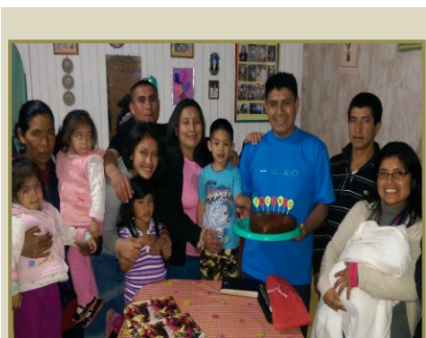
Grupo de Comunión Las Lomas Km 39-Pachacútec