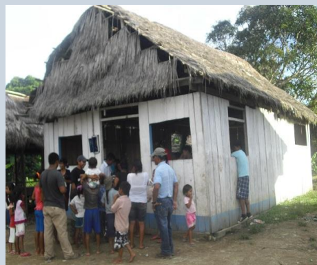
Comunidad "Nueve de Octubre"

"Si Jesucristo siendo Dios murió por mí, entonces ningún sacrificio que yo haga sería demasiado grande para Él." CT Studd