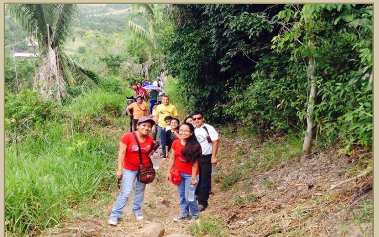
Nuevo Progreso - Shatoja

Si desean saber más sobre nosotros y el trabajo que venimos realizando puede entrar al link que está más abajo