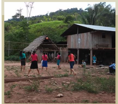
Santa Rosa Valle del Ponaza