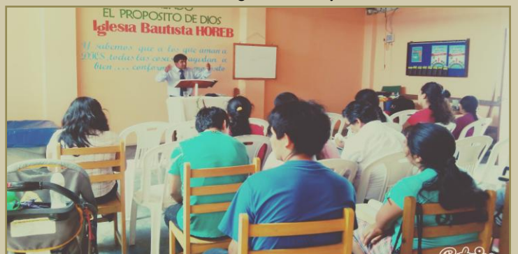
Servicio domingo 25 de enero

Walmart Letona y familia Correo: walmart@gmail.com Blog: www.walmart.wordpress.com Celular: 977 152 276 BCP: 191-2081-4248091