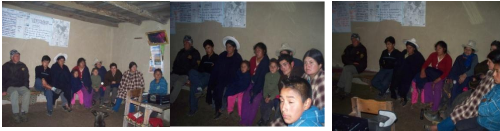
Hermanos de Yanacancha, en nuestro último viaje a esa obra.