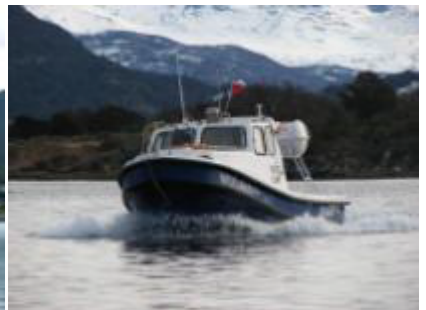
Embarcacion de puerto Williams a Ushuaia