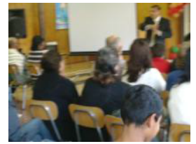
Compartiendo el mensaje de salvación

página Web, www.ibbslp.org o www.ibfic.es.ti