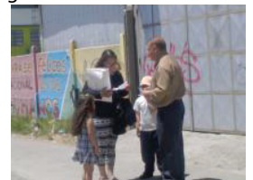
Ganando Almas tocando puertas