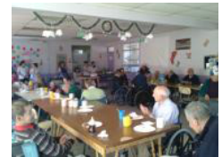
50 ancianos en el Asilo