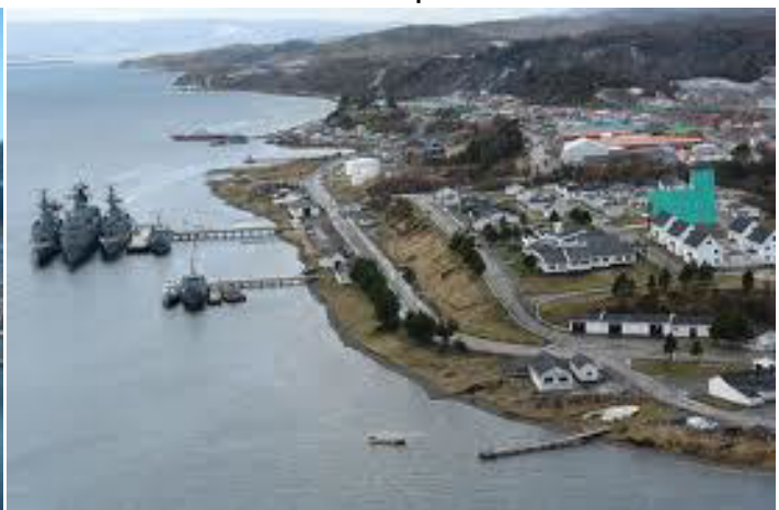
Puerto Williams Chile