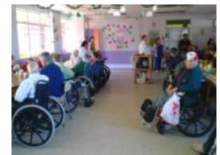
Una puerta abierta en el Asilo