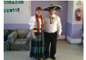
"De todo me hecho para ganar a todos"