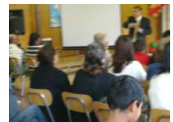
Dando el mensaje de Salvación