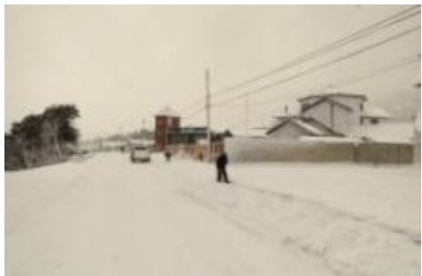
Puerto Williams Invierno