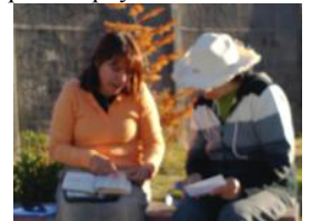
Gracias a Dios por permitirnos hacer la obra.