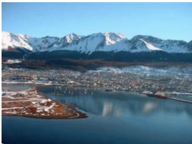
Puerto Ushuaia Argentina